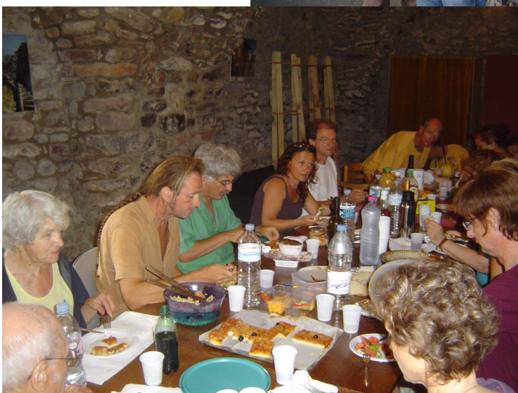
Repas avec le conseil municipal de CELLES – Juin 2006 – Salasc Janvier 2006 – Le groupe de travail en fête