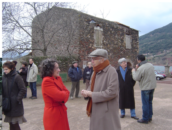
Manifestation conviviale pour l'accrochage de la cloche sur le clocher de Notre Dame de CELLES – Janvier 2006 -