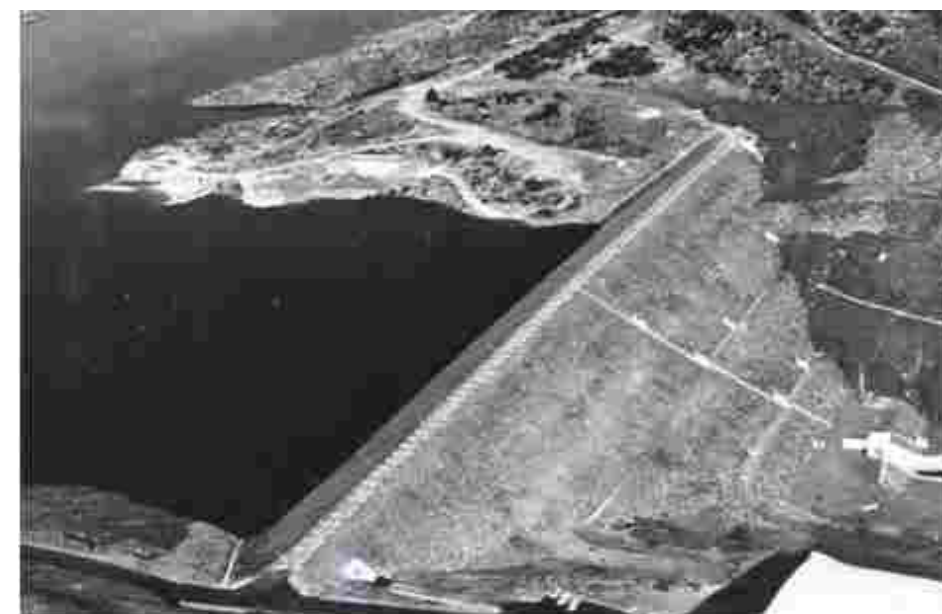
Crédit photo : Bec Frères – image du haut : collection Denis Descouens